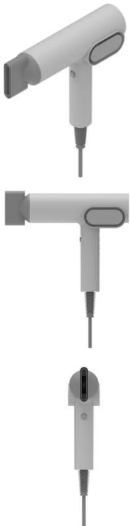
заявленный промышленный образец