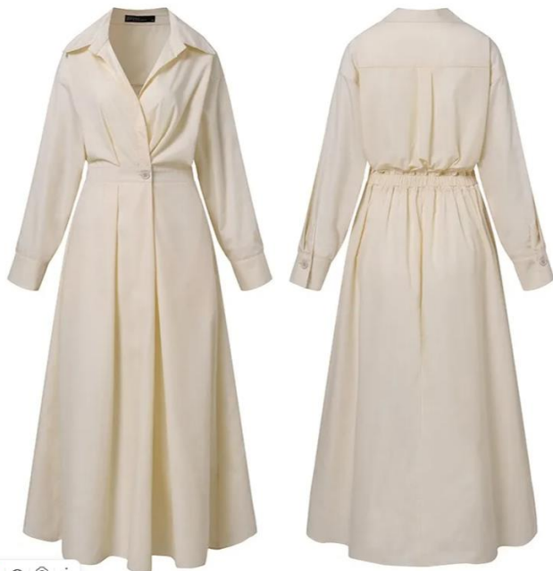
[1] (изображение из карточки товара);