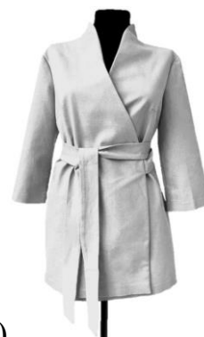
2. Рубашка-кимоно на запах женская (вариант 2)