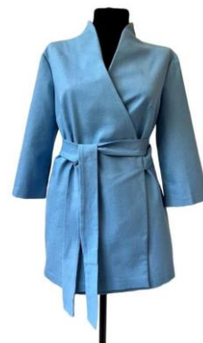
«1. Рубашка-кимоно на запах женская (вариант 1)