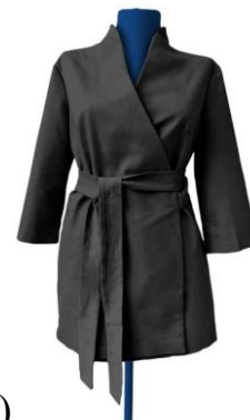
3. Рубашка-кимоно на запах женская (вариант 3)